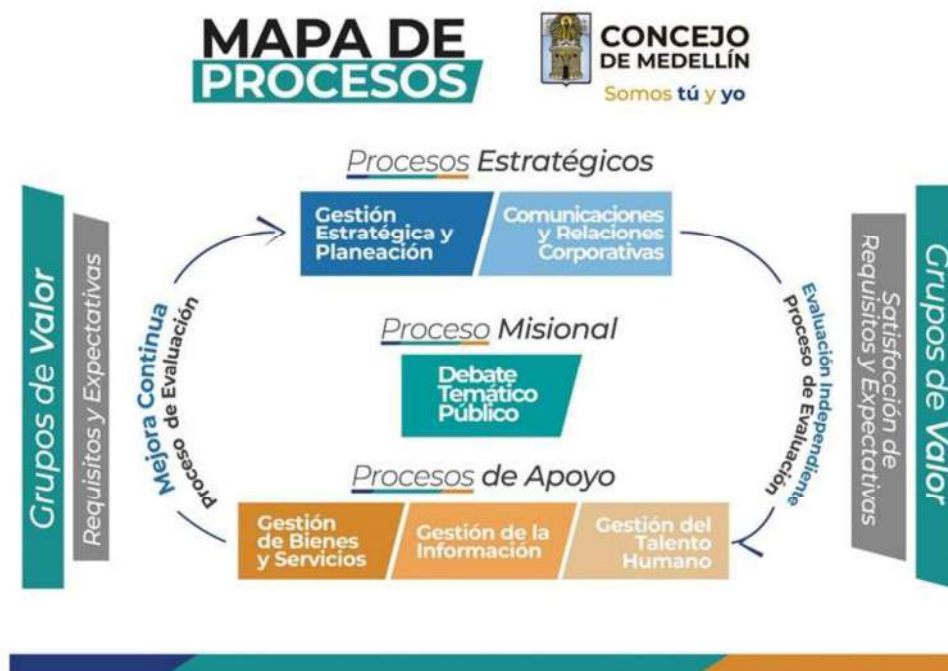
Nuevo Mapa de Procesos Concejo de Medellín 2020.

En este sentido, son 8 los procesos que hoy componen el SGC: