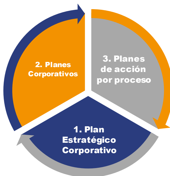
Diagrama niveles de planeación Concejo de Medellín.

La planeación institucional en el Concejo de Medellín comprende 3 niveles: