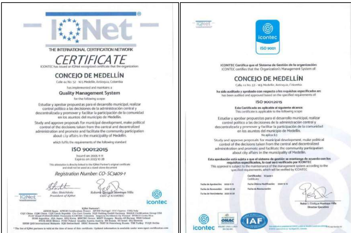
Certificado renovación Icontec, IQNet